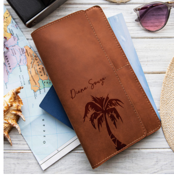
Tekstil ve Moda