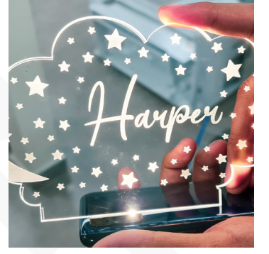
Plastik ve Akrilik