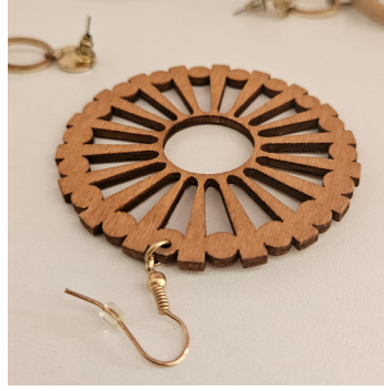
Mücevherat ve Taki